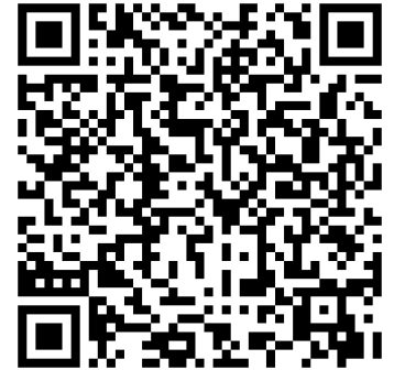
Anmeldung für die Ausbildung