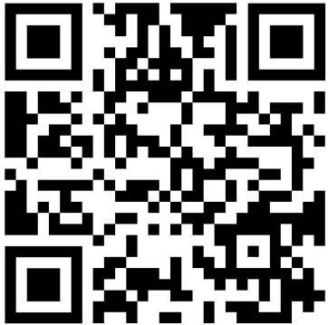
Allgemeine WhatsApp Gruppe